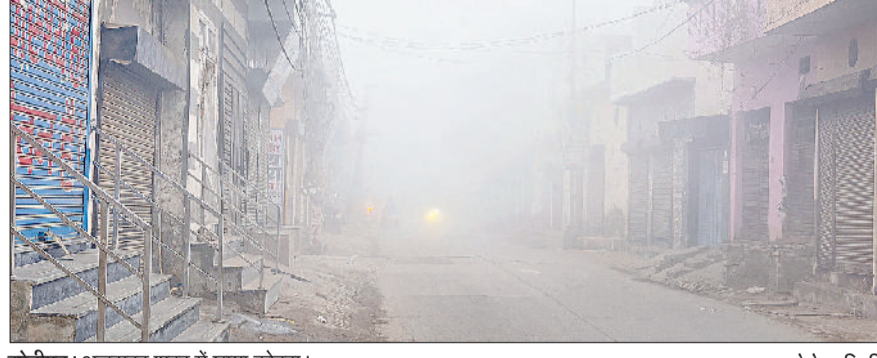
सोनीपत। अलसुबह शहर में छाया कोहरा।