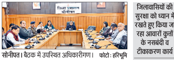
सोनीपत। बैठक में उपस्थित अधिकारीगण।

सर्वोच्च न्यायालय के आदेशों की अनुपालना में जिला प्रशासन आवारा कुत्तों के नसबंदी, टीकाकरण व डी-वार्मिंग जैसे कार्य तेजी से कर रहे है। जिला प्रशासन के द्वारा जिला टास्क फोर्स व जिला निगरानी कमेटी का गठन किया गया व नोडल अधिकारियों की भी नियुक्ति की है। इस साल 30 नवंबर तक नगर निगम सोनीपत के द्वारा 4394 कुत्तों की नसबंदी, टीकाकरण व डी-वार्मिंग की गई है। वहीं 1414 आवारा पशुओं को पकड़