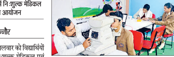
गन्नौर। स्कूल में बच्चों के स्वास्थ्य की जांच करते चिकित्सक।