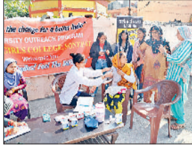
सोनीपत। शिविर में लोगों की जांच करती स्वास्थ्य टीम।