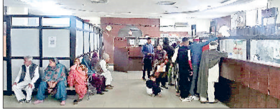
सोनीपत। समाज कल्याण विभाग में पहुंचे लोग।

रहे हैं। इसमें सबसे बड़ा हिस्सा 1,21,419 बुजुर्गों का है। अक्टूबर माह के 1241 पात्रों के दस्तावेज सत्यापन का कार्य लगभग पूरा हो चुका है। अब नवंबर के 398 और दिसंबर के 730 नए पात्रों को जोड़ते ही जिले में कुल पेंशनधारकों की संख्या बढ़कर 2,11,369 हो जाएगी। यह बढ़ोतरी दशांती है कि सरकार की जनकल्याणकारी नीतियां अब धरातल पर अधिक सक्रियता से पहुंच रही हैं।