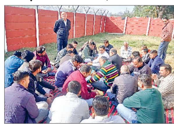
गन्नौर। फील्ड कर्मचारी सरकार की ऑनलाइन पॉलिसी के विरोध में बैठक करते हुए।

■ बिजली विभाग के फील्ड कर्मचारियों ने सरकार की ऑनलाइन पॉलिसी का विरोध जताया